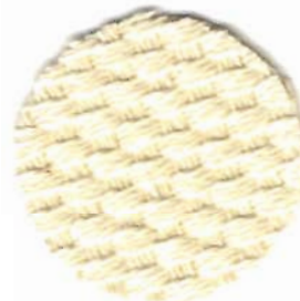
3726 Domino ca. 2 Stiche / cm 100% Baumwolle 60 cm breit

Sehr populäres Aidagewebe mit großer Farbskala. Das ideale Kreuzstich-Gewebe für Bilder und kleine Modelle wird mit 2-fädigem Sticktwist bestickt. Aida-Gewebe gibt es in mehreren Qualitäten, mit Garneffekten und vielen Stichgrößen von 1,45 - 8 Stichen pro cm wie Turkestan, Herta und Hertarette.