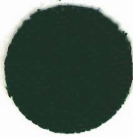
3770 Davosa 7,1 Fäden / cm 100% Baumwolle 140 cm breit In verschiedenen Farben erhältlich

Klassischer Zählstoff zum Erlernen von gezählten Sticktechniken . Er ist auch für die ersten Hardangerversuche sehr beliebt. Obwohl das Gewebe mit ca. 7 Fäden pro cm relativ grob ist, wirkt es durch den Mehrfachzwirn aus reiner Baumwolle keineswegs rustikal.