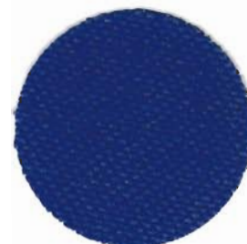
1235 Linda Schülertuch 10,7 Fäden / cm 100% Baumwolle 85 cm breit In verschiedenen Farben erhältlich

Spezialgewebe für Durchzugstickerei. Die Nadel wird in Reihen unter den Fadengruppen durchgeführt und es entstehen dabei „Webmuster“. Diese einfache, aber effektvolle Sticktechnik wird auch in der Therapie eingesetzt.