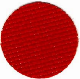
3706 Stern-Aida 5,4 Stiche / cm 100% Baumwolle 110 cm + 150 cm breit In verschiedenen Farben erhältlich

Aida-Gewebe zum Stickenlernen . Vorrangig für Kreuzstich, aber auch für vielerlei Zierstiche. Die Fadenkästchen sind durch Löcher getrennt, durch die die Sticknadel von selbst rutscht. Die Farbskala enthält kräftige Kinderfarben. Herta und Hertarette sind Varianten dieser Gewebeart mit noch größeren Kästchen.