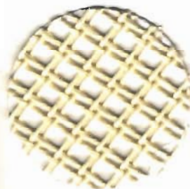
955 Feinsmyrna 1,8 Stiche / cm 67% Polyester 33% Baumwolle 50, 80 + 100 cm breit

Beim Dreherstramin drehen sich die Kettfäden umeinander, binden den Schuss ein und stabilisieren dadurch das offene Gewebe. Der farbige Stramin braucht nicht voll überstickt werden, die Transparenz des Fadengitters ist ein zusätzlicher besonderer Effekt. Die Kanten sind schnittfest, deshalb ist MAGIC CANVAS auch zum Basteln geeignet.