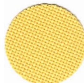
3256 Bellana 8 Fäden / cm 52% Baumwolle 48% Modal 140 + 180 cm breit In verschiedenen Farben erhältlich

Wie der Name schon sagt, war Schülertuch ursprünglich ein Stoff zum Erlernen von Handarbeitstechniken . Der glatte Zählstoff aus Baumwollzwirn ist für alle fadengebundenen Sticktechniken geeignet. Außerdem ist er wegen seiner schmalen Breite für kleinere Stickereien und Bastel-Projekte interessant.