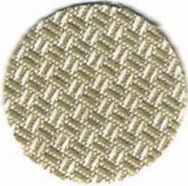
3331 Gerstenkorn 3 Stiche / cm 100% Baumwolle 170 cm breit In verschiedenen Farben erhältlich

Klassischer Zählstoff zum Erlernen von gezählten Sticktechniken . Er ist auch für die ersten Hardangerversuche sehr beliebt. Obwohl das Gewebe mit ca. 7 Fäden pro cm relativ grob ist, wirkt es durch den Mehrfachzwirn aus reiner Baumwolle keineswegs rustikal.