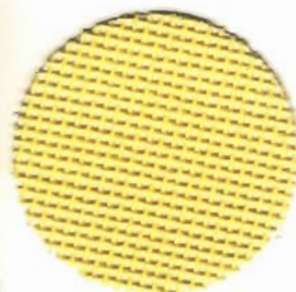
1010 Camilla 6,8 Fäden / cm 100% Baumwolle 60 cm breit

2-fädiger Stramin in creme Farbton mit steifer Appretur. Durch die Polyester-Baumwoll-Mischung ist dieser Stramin sehr stabil und deshalb besonders als Knüpfstramin für feine Teppiche geeignet. Für Bilder und Wandbehänge in Grobkreuzstich ist diese Straminqualität ebenso empfehlenswert.