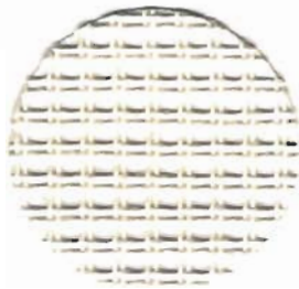
500/26 Stramin 2,6 Stiche / cm 100% Baumwolle 60 cm breit

Spezialgewebe für Durchzugstickerei mit ausgeprägter Flechtstruktur. Die Nadel wird unter den doppelten Fadestegen durchgeführt und die Stickerei liegt ganz auf der Oberseite des Gewebes. Für „schnelle“ Projekte geeignet. Diese Sticktechnik wird auch in der Therapie genutzt.