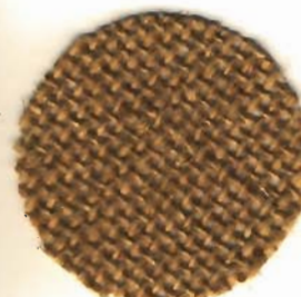
3926 Edelrupfen ca. 5 Fäden / cm 100% Jute 120 cm breit

Auch Congress-Stoff genannt. Das Gewebe ist offen wie ein Stramin gewebt und daher leicht zu zählen. Es ist auch so steif wie Stramin appretiert. Auf diesem Gewebe haben Kinder in der Schule meist sticken gelernt und alle Arten von Zierstichen geübt.