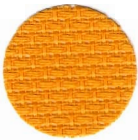
1006 Aida 3,25 Stiche / cm 100% Baumwolle 60 cm breit In verschiedenen Farben erhältlich

Als Zählstoffe werden Handarbeitsstoffe bezeichnet, die für fadengebundene Stickerei geeignet sind. Sie haben eine klare Oberflächenstruktur und sind „quadratisch“ gewebt, das heißt, Kette und Schuss haben die gleiche Fadenzahl. Die meisten Handarbeitsstoffe sind etwas fester ausgerüstet als allgemein üblich, was das Sticken ganz wesentlich erleichtert. Stramine sind sehr steif appetriert.